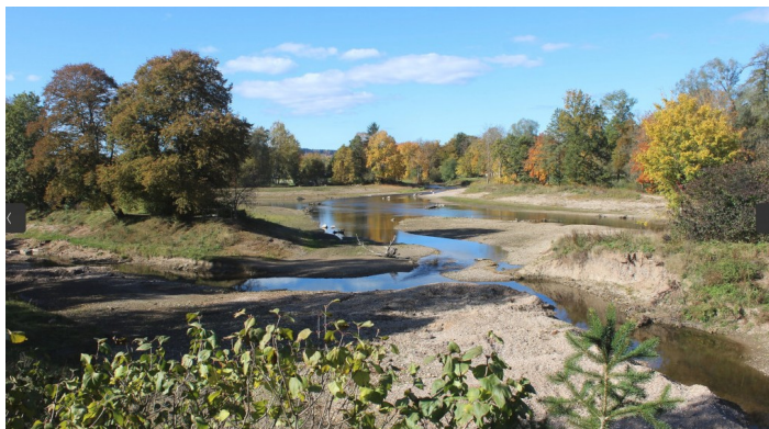
Andredonau, Donauursprung Herbst 2021, CC BY-SA 4.0

Weitere Infos: www.schwarzwaldverein-haeusern.de