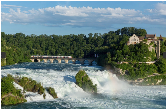
SBB RABe 514 DTZ Rheinfall

Weitere Infos: www.schwarzwaldverein-haeusern.de