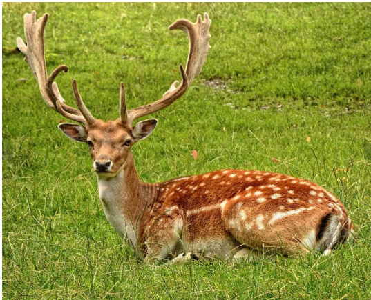
© Brown Deer Laying Auf Grasfeld

Weitere Infos: www.schwarzwaldverein-haeusern.de