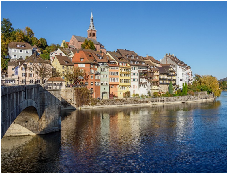
© JoachimKohler-HB, Laufenburg (Deutschland), CC BY-SA 4.0

Weitere Infos: www.schwarzwaldverein-haeusern.de